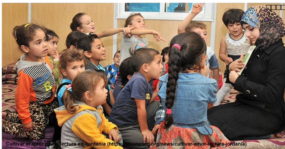
Cultivar el amor por la lectura en Jordania ( https://es.unesco.org/news/cultivar-amor-lectura-jordania )